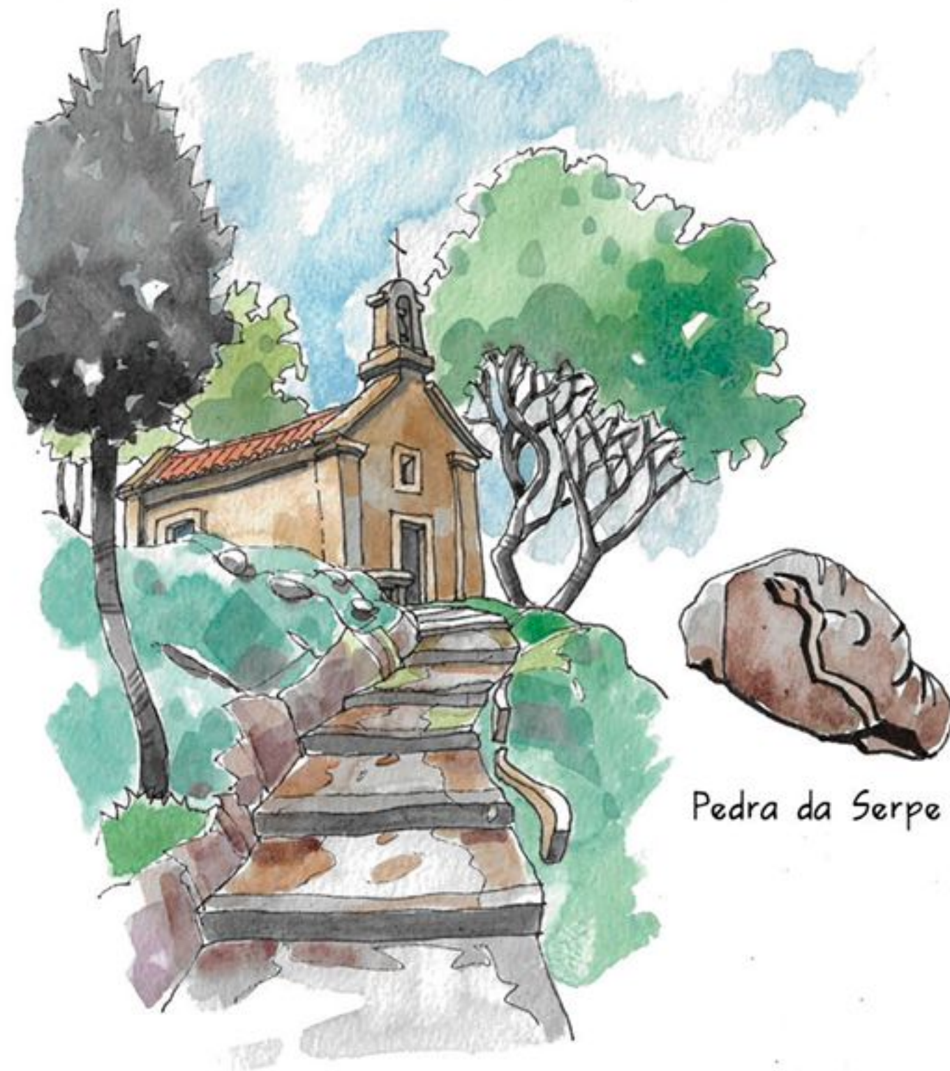
Pedra da Serpe