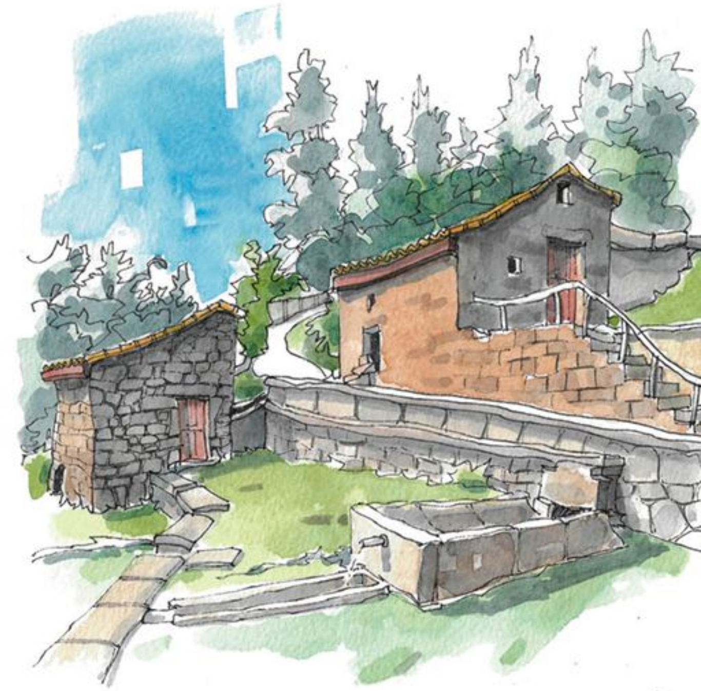
Muiños de Muimenta