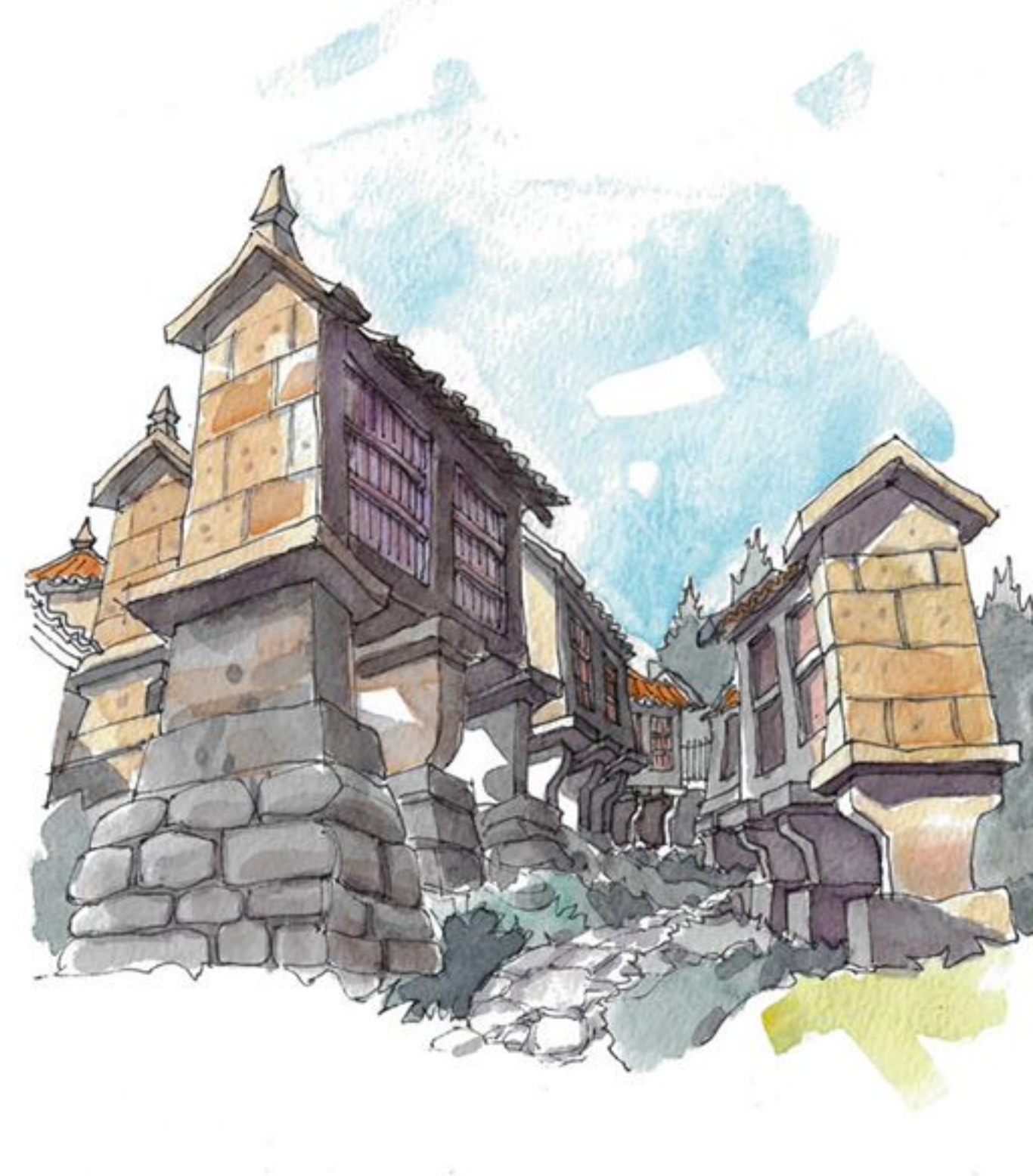
Hórreos de Parada